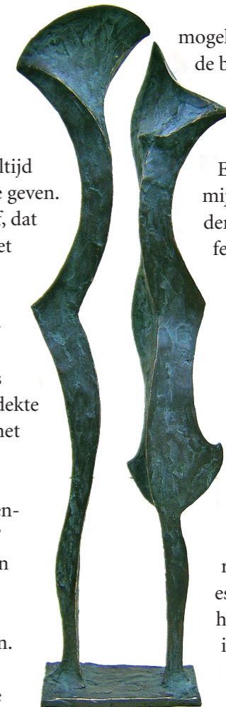
"Relation" Brons, 2006

Ik had "mijn stijl" niet kunnen bedenken. Dat overkwam me en dat groeit. Mijn uitdaging is om in de grootst